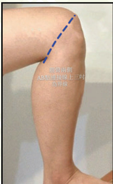
脛骨兩側AB點連接線上三吋為界線