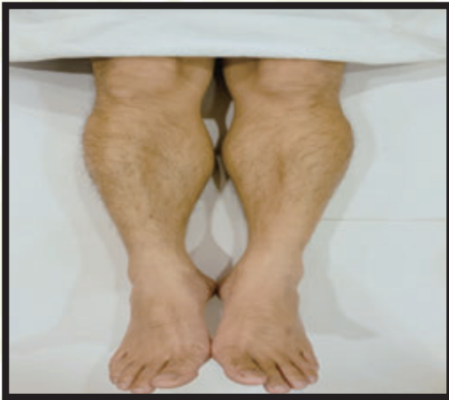
參考照1(小腿最少毛量) 腿毛長度不得短於1cm