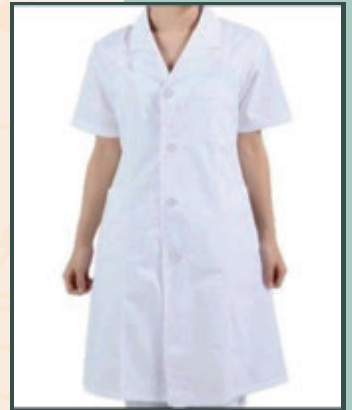
工作服圍裙樣式不限 ▼